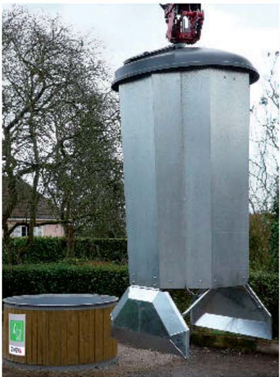
Trappes de fond étanche 100 L