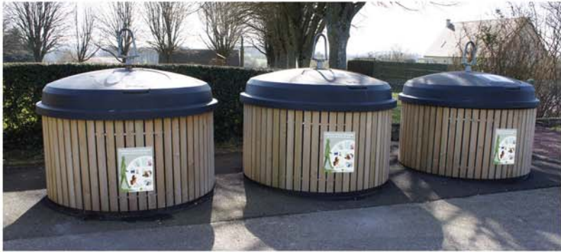
Conteneurs semi-enterrés habillage bois