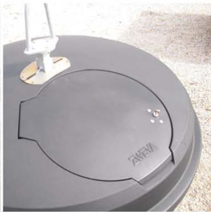
Exclusivité : couvercle arrasant