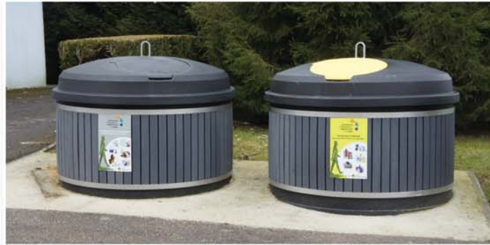
Conteneurs semi-enterrés habillage composite