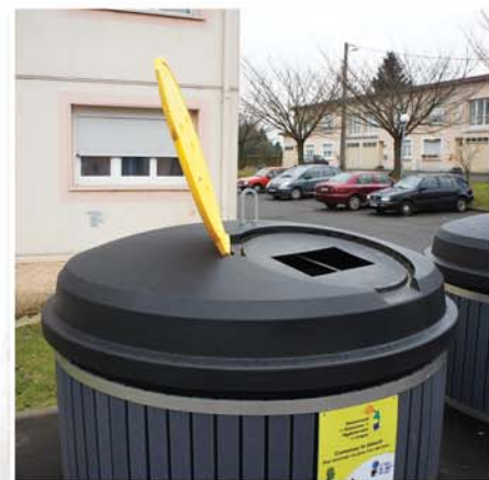
Orifice restrictif sous couvercle de couleur