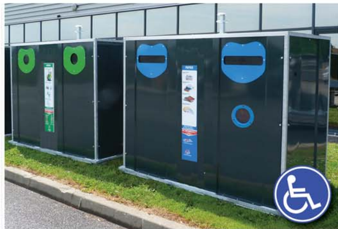
Point d'apport Métal 4 à 6 m 3 avec option «PMR»