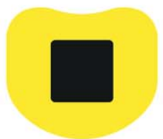
Enjolleur acier peint en option