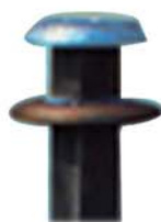
Coupelles d'origine Kinshofer