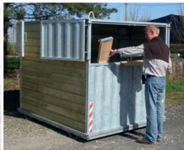
Trappe «Gros Volumes»