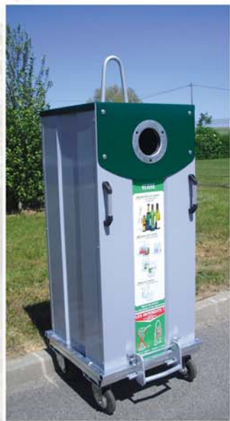
Conteneur 600 L à roulettes