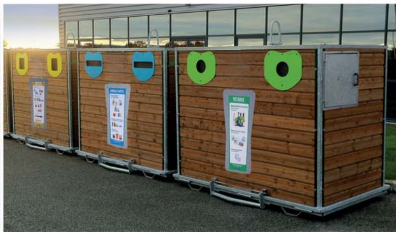
Point d'apport Bois 4 à 6 m 3 avec option trappe «Gros Volume»