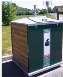
Conteneur 2 m 3